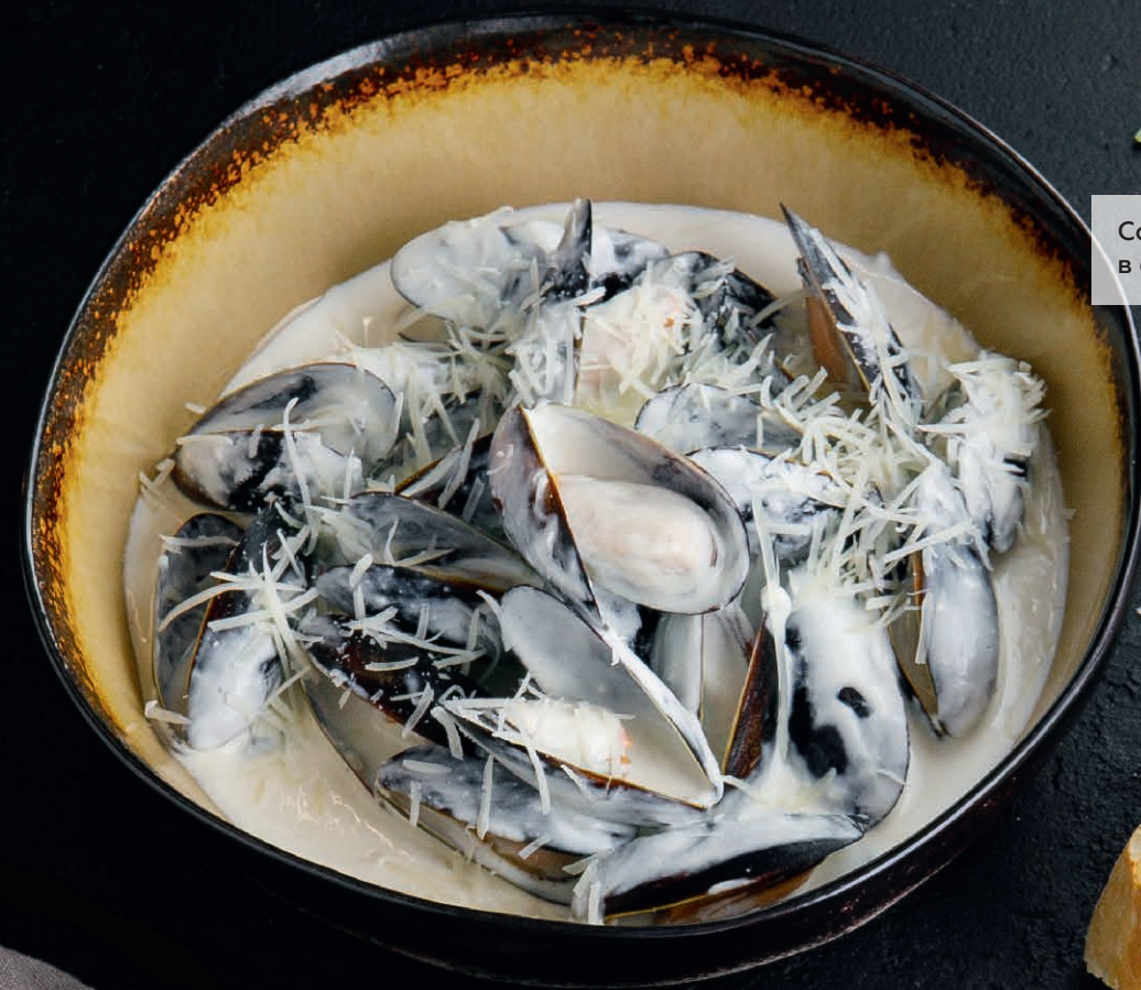
Соте из мидий в сливочном соусе / в соусе дорблю 820 ₺/860 ₺