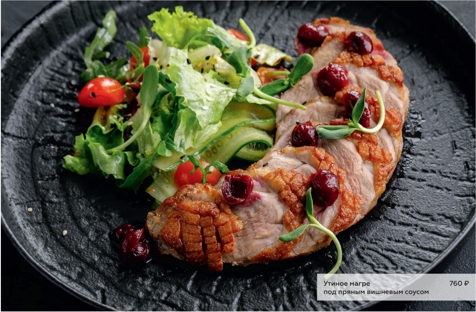
Утиное магре под пряным вишневым соусом 760 ₽

Если у вас есть аллергия на определенные продукты питания — сообщите об этом своему официанту.