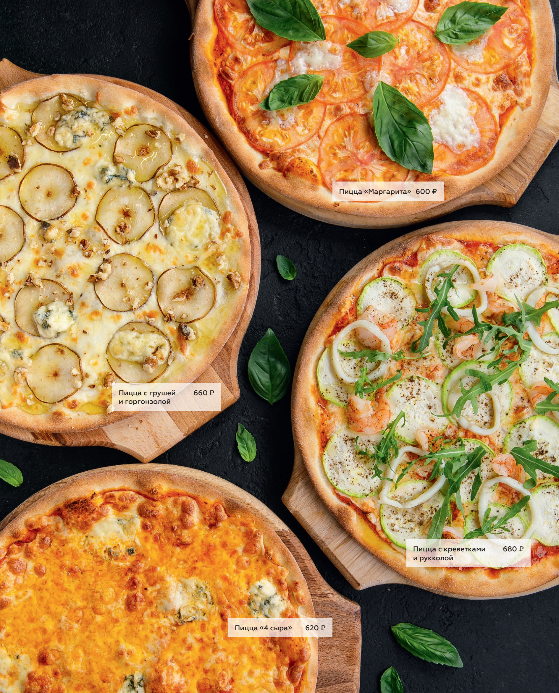
Пицца «Маргарита» 600 ₽