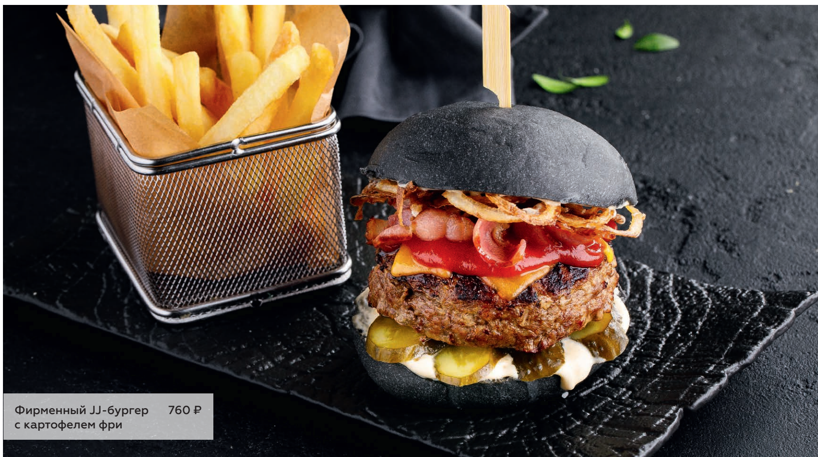
Фирменный JJ-бургер с картофелем фри 760 ₺