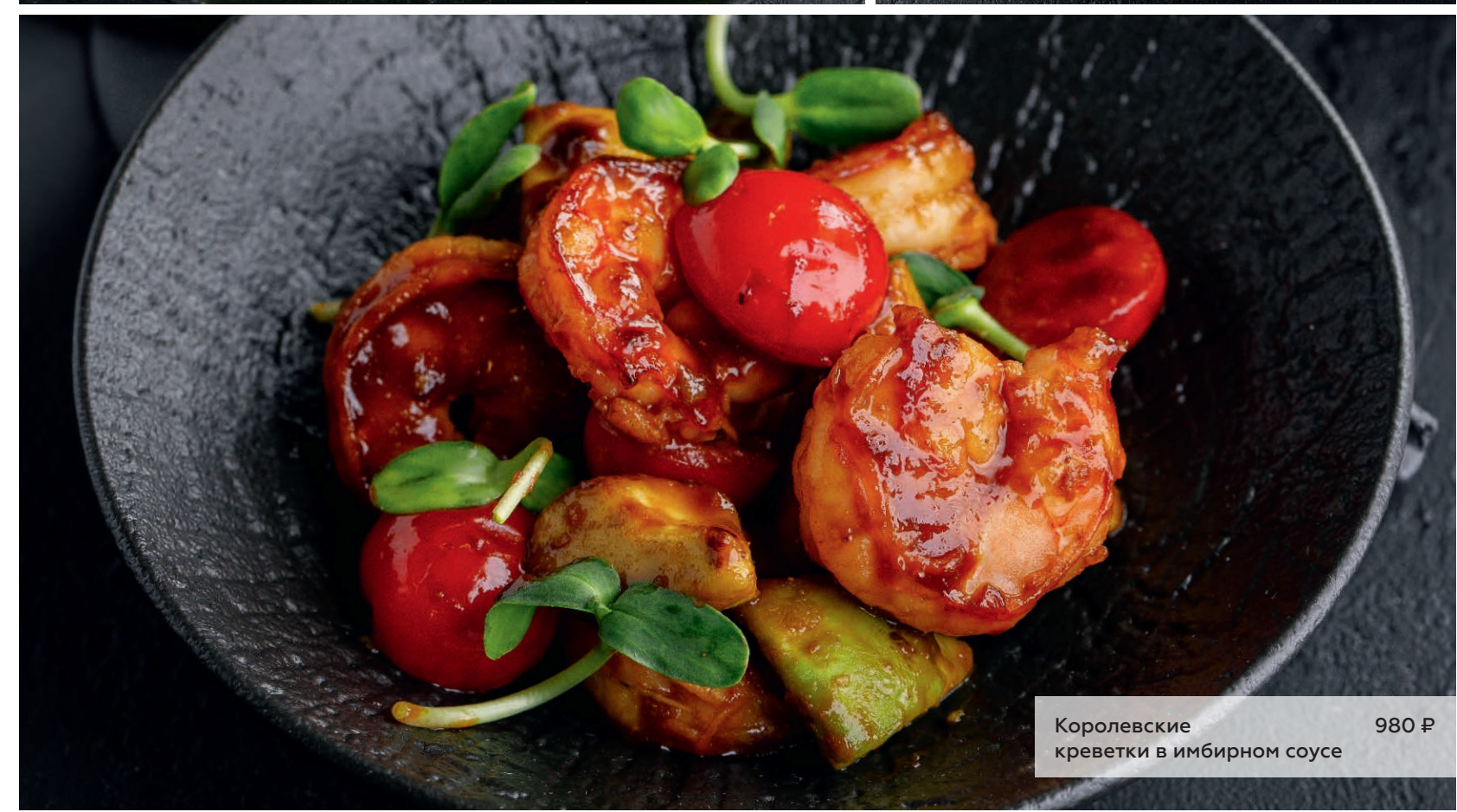
Королевские креветки в имбирном соусе 980 ₽

Если у вас есть аллергия на определенные продукты питания — сообщите об этом своему официанту.