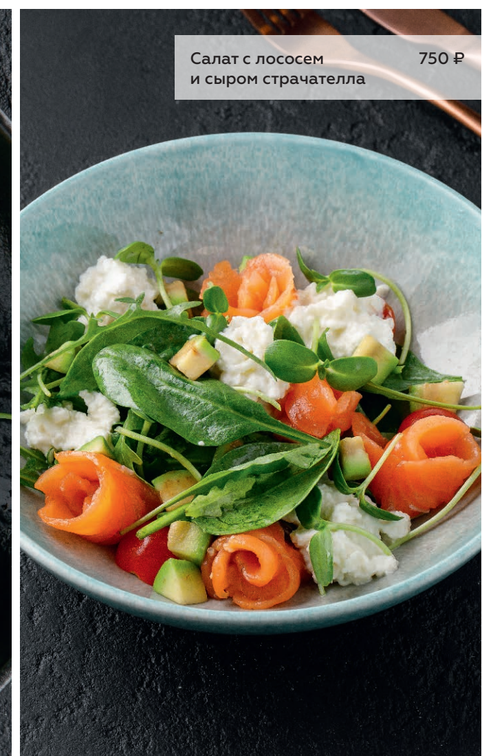
Салат с лососем и сыром страчателла 750 ₽