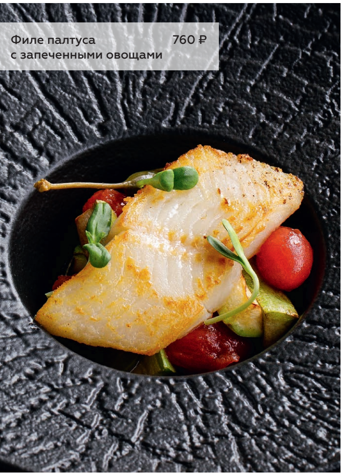
Филе палтуса с запеченными овощами 760 ₽