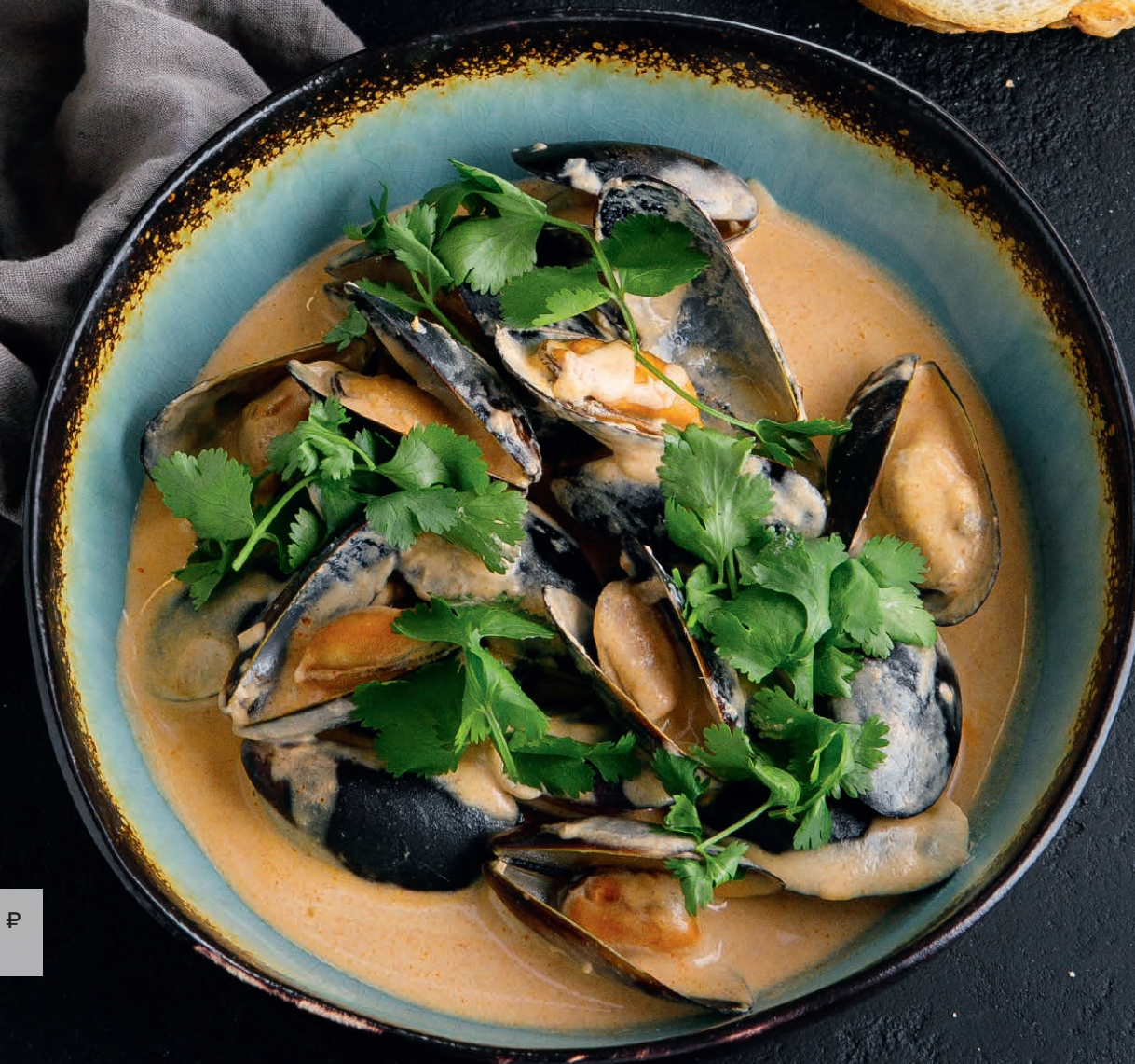
Соте из мидий в соусе том ям 820 ₺