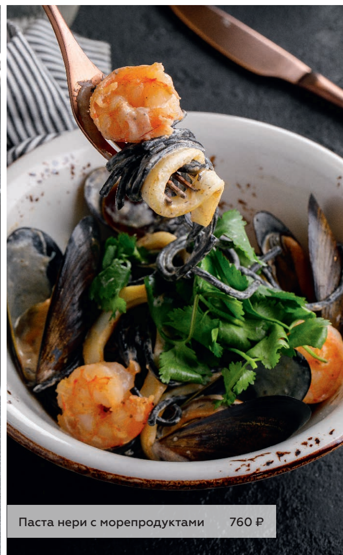
Паста нери с морепродуктами 760 ₺