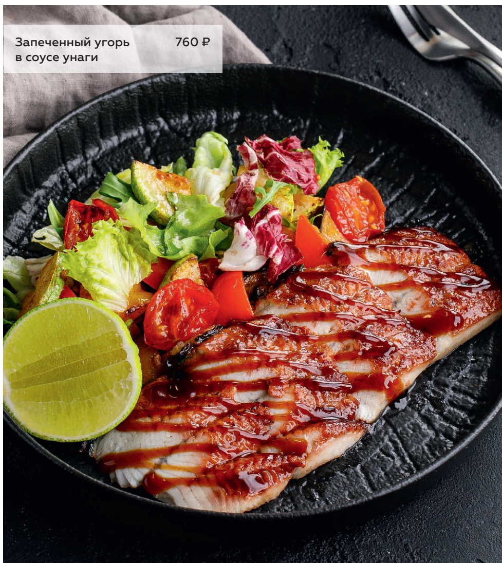
Запеченный угорь в соусе унаги 760 ₺