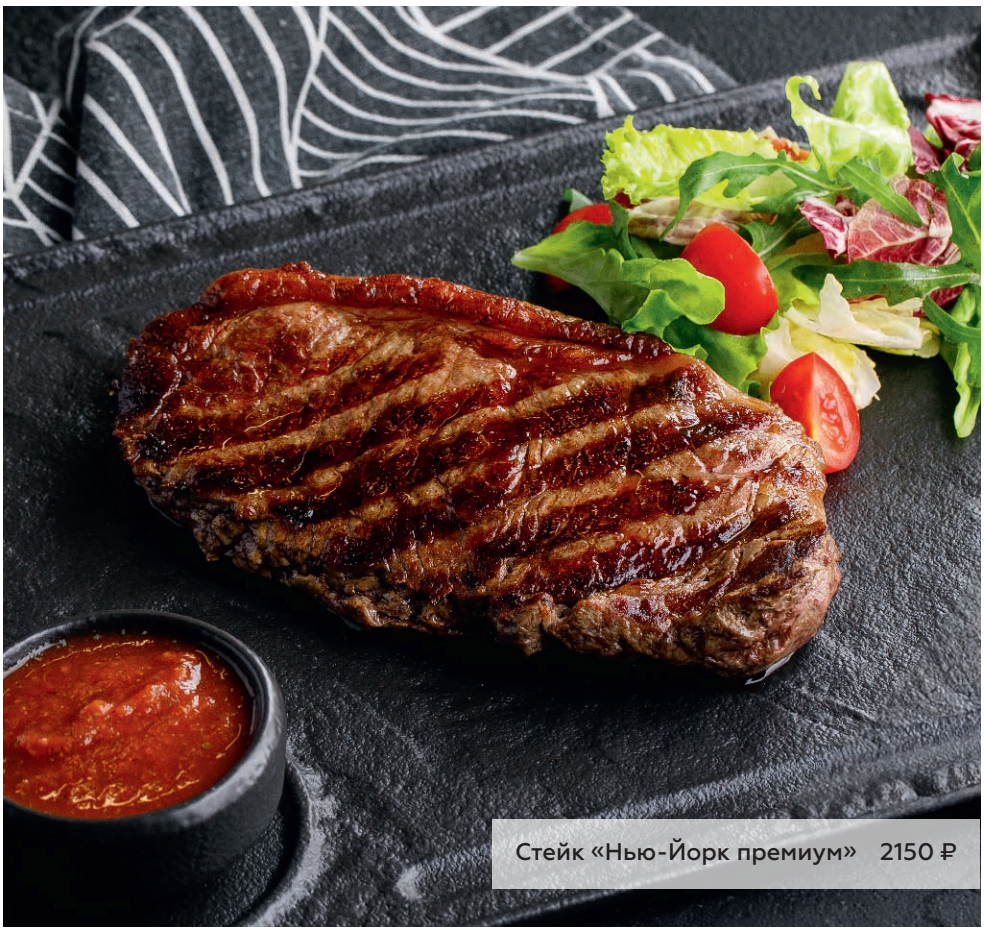
Стейк «Нью-Йорк премиум» 2150 ₽